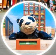
หมีแพนด้าปิ่นตึก IFS