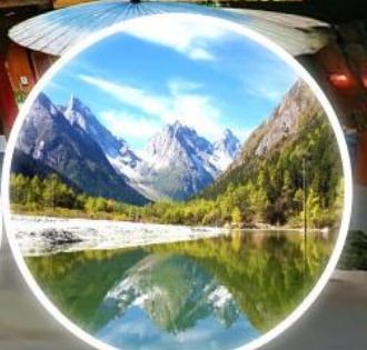
อุทยานแห่งชาติปี้เฉิงโกว