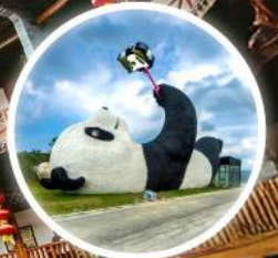
หมีแพนด้าเซลฟี