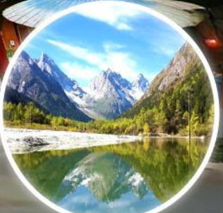
อุทยานแห่งชาติปี้เฉิงโกว