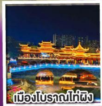
เมืองโบราณไท่ผิง