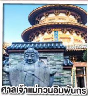
ศาลเจ้าแม่กวนอิมพันกร