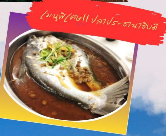
เมนูพิเศษ!! ปลาประธนาธิบติ

นำท่านเดินทางสู่ วัดเหวินหวู่ Wenwu Temple หรือ วัดกวนอู ตั้งอยู่ระหว่างเขาทางทิศเหนือของทะเลสาบสุริยันจันทรา สร้างขึ้นเมื่อปี ค.ศ. 1938 ภายในวัดมีรูปปั้นของซ่งจื้อและเทพกวนอู (เทพเจ้าแห่งปัญญา และเทพเจ้าแห่งความซื่อสัตย์) ซึ่งชาวไต้หวันเชื่อกันว่า หากได้บูชาเทพเจ้ากวนอู จะได้ประสบความสำเร็จในหน้าที่การงาน มีแต่คนจงรักภักดี หรือหากวางแผนสิ่งใด ก็จะได้ประสบความสำเร็จตามปรารถนาเป็นวัดศักดิ์สิทธิ์อีกแห่งหนึ่งของไต้หวัน แต่เดิมในอดีตริมฝั่งทะเลสาบสุริยันจันทราเป็นที่ตั้งของ 2 วัดเก่า คือวัดหลงเฟิง Longfeng Temple และวัดหัวถั่ง Huatang of Shuishotsun ชาวบ้านกล่าวว่าน้ำจากทะเลสาบสุริยันจันทรา จะทะลักเข้ามาท่วมวัดหลงเฟิงและวัดหัวถั่ง จึงสร้างวัดเหวินหวู่ขึ้น แล้วรวมวัดทั้งสองแห่งไว้ในวัดเหวินหวู่เพียงแห่งเดียว และสร้างกำแพงให้แข็งแรงยิ่งขึ้น เพื่อรับมือกับน้ำจากทะเลสาบสุริยันจันทราที่หนุนขึ้นสูง ในปัจจุบัน สถาปัตยกรรมของวัดนี้เต็มไปด้วยงานแกะสลักหินจำนวนมาก รวมถึงสิงโตหินอ่อน 2 ตัว ที่ตั้งอยู่บริเวณด้านหน้าของวัดซึ่งมีมูลค่าตัวละ 1 ล้านเหรียญไต้หวัน โดยตัววิหารใหญ่แบ่งออกเป็นสามชั้นและมีวิหารเล็กโอบล้อมอยู่ด้านข้าง และเป็นจุดชมวิวที่สวยงามอีกแห่งหนึ่งของทะเลสาบสุริยันจันทราอีกด้วย