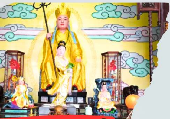
วัดพระถังซัมจั๋ง Xuanguang Temple

นำท่านเดินทางสู่ ทะเลสาบสุริยัน จันทรา Sun Moon Lake ซึ่งเป็นทะเลสาบน้ำจืดที่เกิดขึ้นตามธรรมชาติที่ใหญ่ที่สุดของไต้หวัน และยังมีเส้นทางจักรยานรอบทะเลสาบมีความยาวถึง 33 กิโลเมตร ที่ถูกจัดอันดับให้ติดอยู่ 1 ใน 10 ของเส้นทางจักรยานทั่วโลก โดย ซีเอ็นเอ็นโก (CNNGO) ทะเลสาบสุริยันจันทรา มีความสูงเหนือระดับน้ำทะเล 748 เมตร มี เกาะลาอู (Lalu Island) ตั้งอยู่กลางทะเลสาบ โดยทางตอนใต้ของเกาะลาอู มีรูปปั้นกลมคล้ายกับพระจันทร์ ส่วนทางตอนเหนือของเกาะ มีรูปปั้นคล้ายกับพระอาทิตย์ จึงเป็นที่มาของชื่อทะเลสาบสุริยันจันทรานั่นเอง และยังเป็นตำแหน่งฮวงจุ้ยที่ดีมีมังกรล้อมรอบ พื้นที่บริเวณนี้ถือว่าเป็นจุดรับพลังมังกรที่สมบูรณ์ที่สุดของไต้หวัน จากนั้นนำท่าน นั่งเรือยอร์ชล่องทะเลสาบสุริยัน จันทรา ชมความงามบรรยากาศรอบๆ ทะเลสาบแห่งนี้