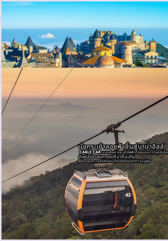
นั่งกระเช้าลอยฟ้าขึ้นสู่บานาฮิลล์ CABLE CAR บานาฮิลล์ กระเช้าไฟฟ้าที่สูงและยาวที่สุดในโลก สัมผัสประสบการณ์ที่น่าตื่นตาตื่นใจ พร้อมชมทิวทัศน์ของธรรมชาติอันสวยงาม