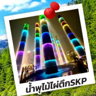
น้ำพุไม้ไฟตึกSKP

อุทยานปี้เผิงโกว อุทยานจิ้งจายโกว 6วัน 5คืน