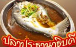
ปลาประจักษ์ชาติดี