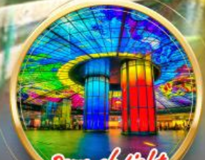
Dome of Light จุดถ่ายรูปสุดฮิตกลางเมืองเกาสง