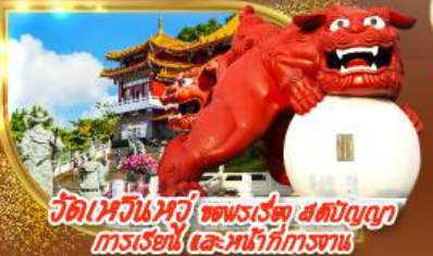
วัดเหวินหวู่ ชมพระเวทย์ สัตว์บุญญา การเวียนเทียน และหน้าที่การงาน