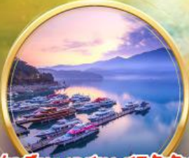
ล่องเรือทะเลสาบ สุริยันจันทรา ท่ามกลางขุนเขาและน้ำใสบริสุทธิ์ (รวมเรือ)