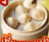
แก๊งจวงหลงทง