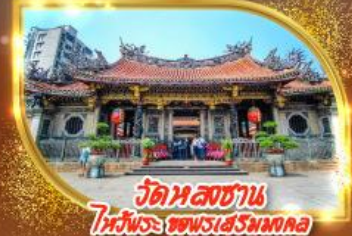
วัดหลวงชาน ไหว้พระ ชมพระเสริมมงคล