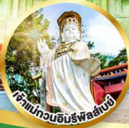
เจ้าแม่กวนอิมรัฟลัสเบย์