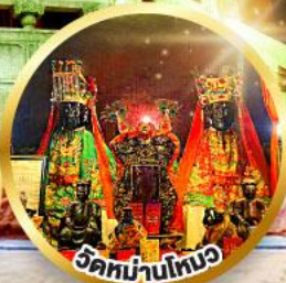
วัดม่านไหมว

ขอพรเรื่องการศึกษา, การงาน สติปัญญาและความกล้าหาญ