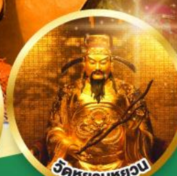
วัดหยวนหยวน

ขอพรเรื่องสุขภาพ, โชคลาภ ความเจริญก้าวหน้า