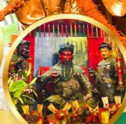
วัดกวนโก