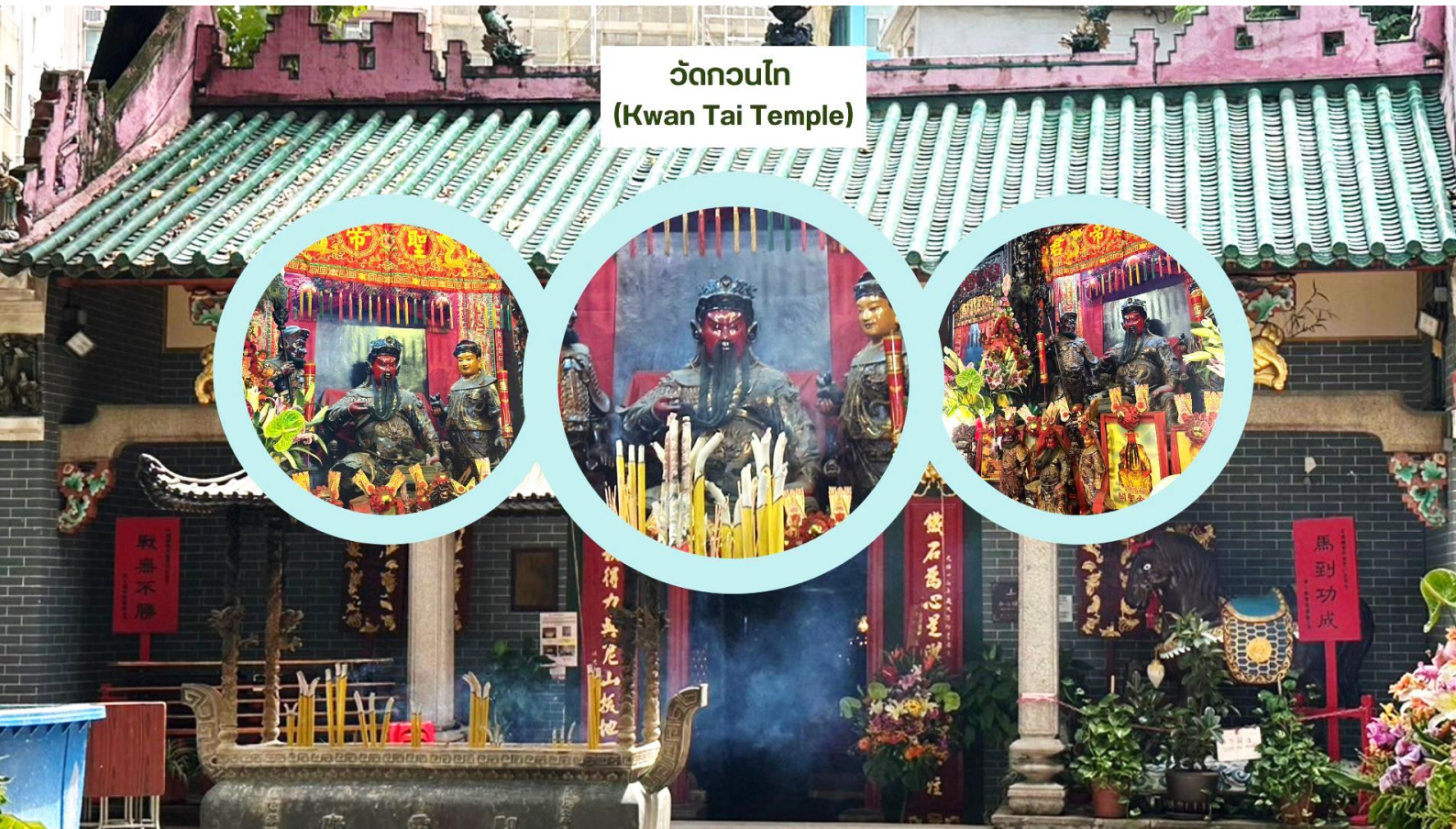
วัดกวนไท (Kwan Tai Temple)

จากนั้นนำท่านเดินทางสู่ วัดกวนไท (Kwan Tai Temple) สร้างขึ้นในปี 1891 เพื่อบูชาเทพเจ้ากวนอู ซึ่งเป็นเทพเจ้าแห่งความซื่อสัตย์ และเปี่ยมไปด้วยคุณธรรม ภายในวัดมีรูปปั้นกวนอูขนาดใหญ่ตั้งอยู่ที่แท่นบูชา มีผู้คนจำนวนมากมาสักการะท่านกวนอูเพื่อขอพรให้ประสบความสำเร็จในธุรกิจ เรื่องความโชคดี โชคลาภ การค้าขาย และการปกป้องคุ้มครอง